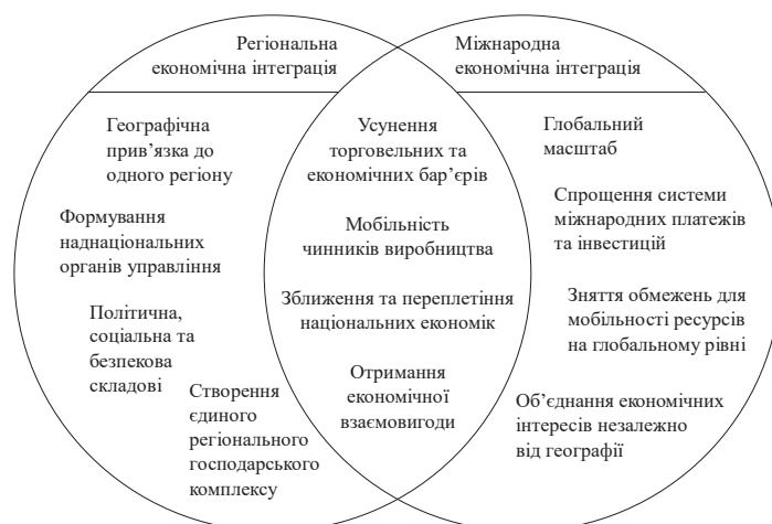
Рис. 2. Структурно-логічна модель взаємозв'язку регіональної та міжнародної економічної інтеграції

Висновки. У результаті дослідження узагальнено та систематизовано наукові підходи до трактування понять