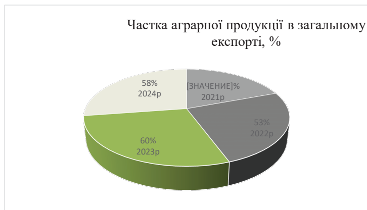
Рис. 1. Динаміка частки аграрної продукції в загальному експорті України, %