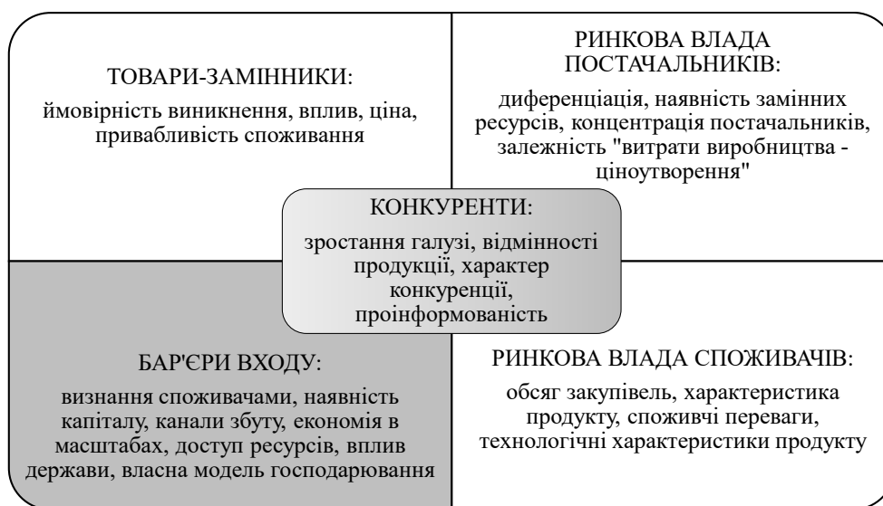
Рис. 2. Фактори конкурентоспроможності сільськогосподарських підприємств в концепції 5 сил М. Портера під впливом глобальних чинників

Ринкова конкуренція характеризується економічною боротьбою між виробників, постачальників і споживачів товарів на найвигідніших умовах їх виробництво, продаж або споживання. Це водночас спосіб вибору оптимальне економічне рішення між ними. Економічна доцільність вибору в такому випадку підтверджується станом ринкової рівноваги між пропозицією і попит на конкретному ринку. В умовах розвинених ринкових відносин, конкуренція спонукає до пошуку нових, більш досконалих організаційних форм бізнесу, до розвитку та впровадження