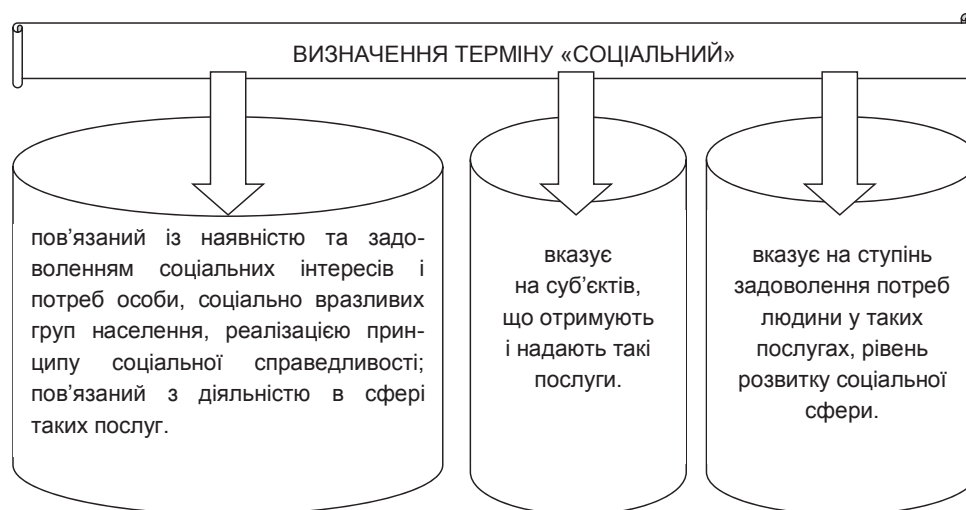
Рисунок 2. Ідентифікація терміну «соціальний»

Поняття «послуга» визначається як дія, яка надає допомогу іншим або як сфера діяльності установ чи окремих осіб, що направлена на задоволення чієїсь потреб [5]. Економічний енциклопедичний словник визначає поняття «послуга» як особливу споживчу вартість процесів праці, що виражається в корисному ефекті, який може задовольнити потреби як людини, так і суспільства в цілому. Послуги – це відповідні блага, що існують в різних видах діяльності і направлені на задоволення потреб населення. Економічний смисл даного поняття полягає в тому, що послуга приносить користь не як фізичний об'єкт, а як певна діяльність. Це означає, що отримання послуг пов'язано з процесом їх створення.