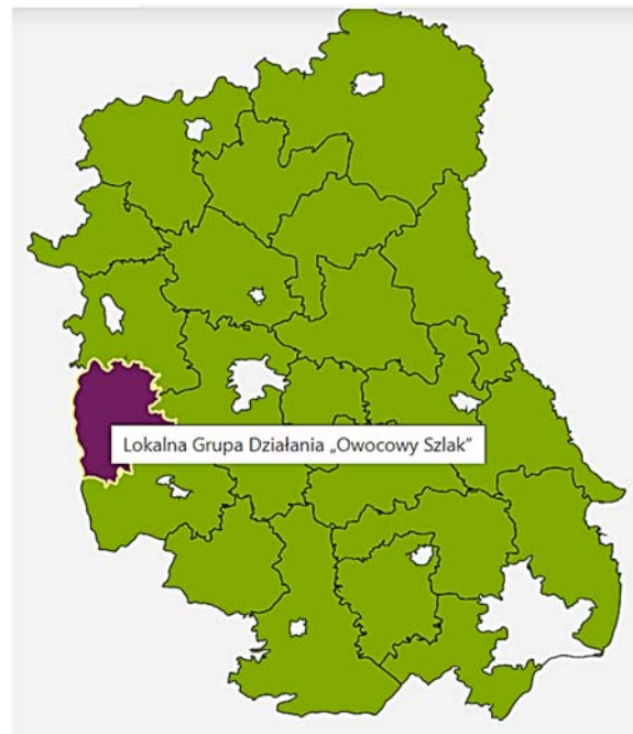
Рисунок 2 – Локальна група діяльності «Фруктова стежка»