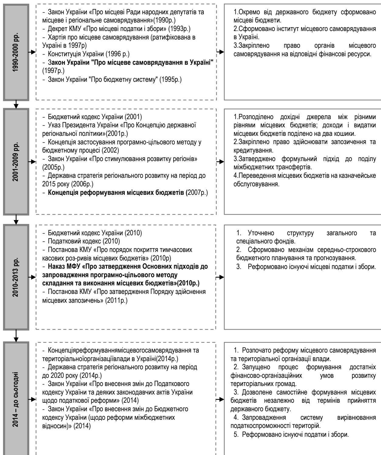
Рис. 1. Періодизація розвитку системи місцевих бюджетів в умовах незалежності України