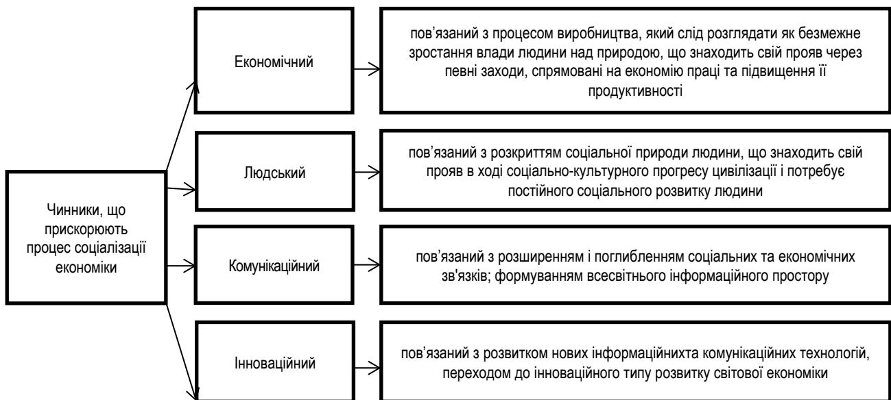
Рис. 1. Чинники, що прискорюють процес соціалізації економіки в умовах формування постіндустріального суспільства та постіндустріальної економіки